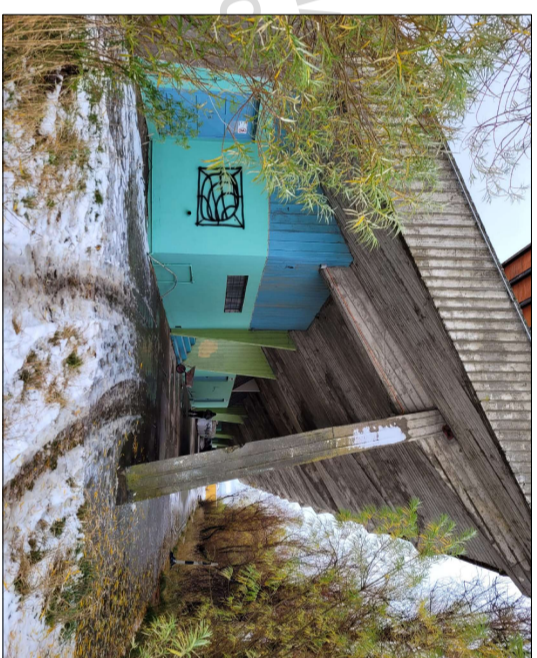
Vista interior graderías.